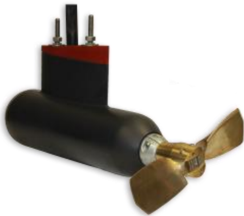
AQUAMOT PROFESSIONAL LINE